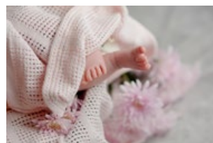
"New Born Party" Ceremonia de bienvenida