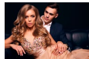
Invitación a ceremonia